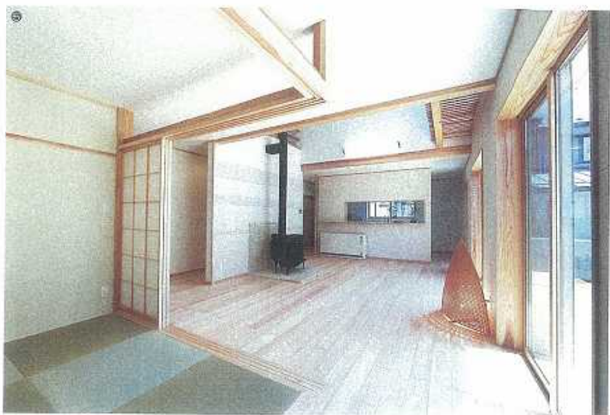
⑤和室の角に柱がないため障子を開放すればリビングと一体になった広い空間が生まれます。2階とのふれあいにも配慮した対面式キッチンで家族のコミュニケーションも充実。