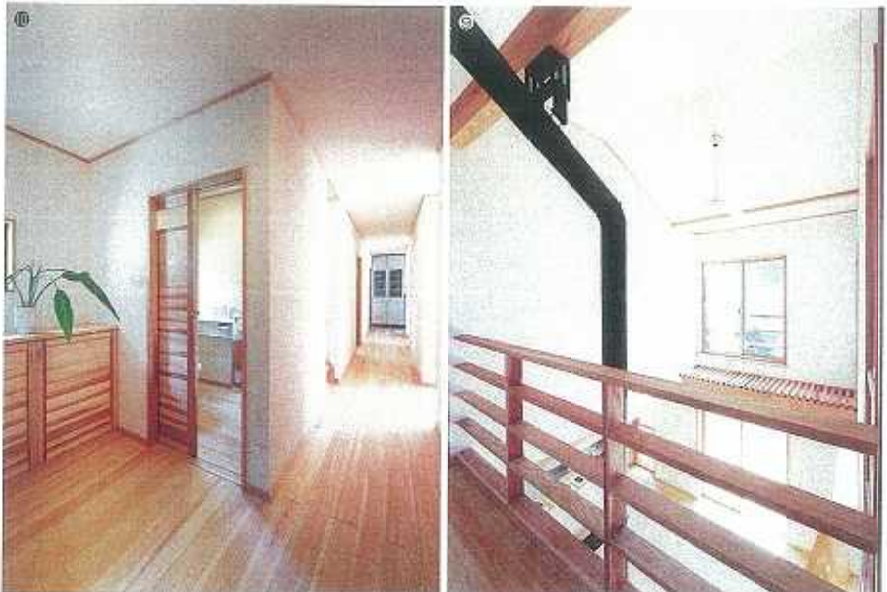
⑨吹抜けを通る薪ストーブの煙突から発する輻射熱が2階全体をもあたためます。クリーンで体にやさしい暖房システムです。⑩1階中央に廊下を配して各部屋への出入りをスムーズにした機能的な動線。手前の寝室から車いすでもラクに行けるようトイレまわりを広くとっています。