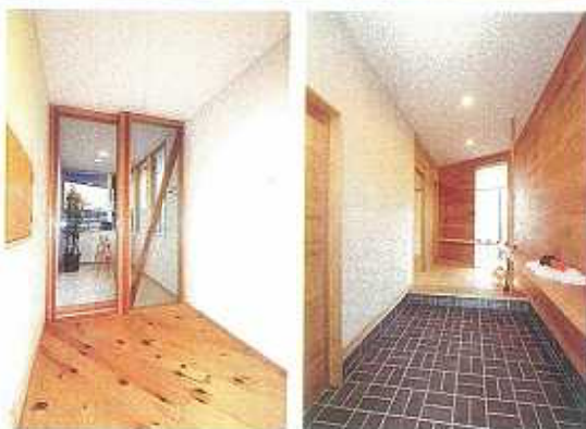
右/玄関タイル、漆喰の白壁、サクラ の畳のバランスが絶妙な空間。コ ートの入る大きな収納庫も付随です。 左/無垢材の床がしゆれにも心地良 さそうなインナーテラス前の通路。ガラ スの向こうは日当たりの良いイン ナーテラス。奥様の家事スペースにび たりです。 下/階段を上った2階のホール。吹 き抜けに面した作りつけのテー ブルからは、リビングにいる家族の様子 がひと目でわかります。