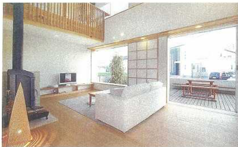
対面式のキッチンに面したリビングルームとダイニングルーム。 吹き抜けの空間、ウッドデッキのテラスへの視線の広がりか、開放感をもたらします。