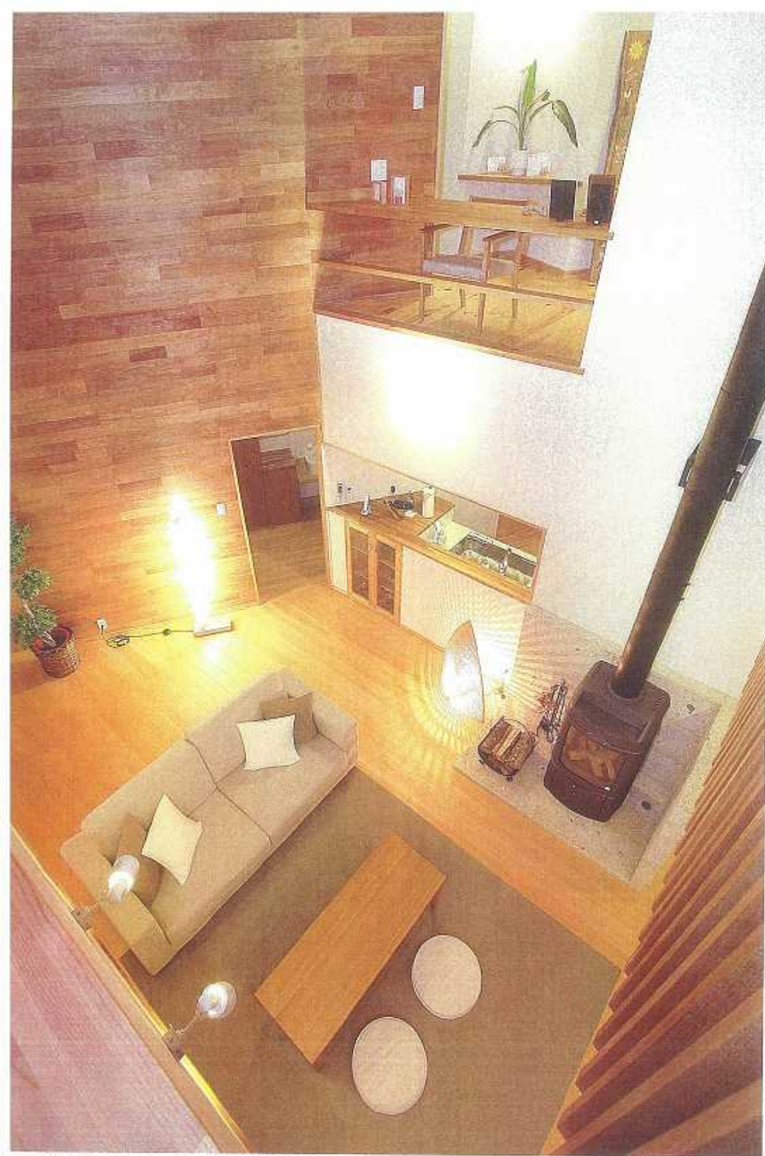
クラの壁板が2階天井まで続き、木のぬくもりが広がるリビングルーム。吹き抜けに設けた縦長の窓から、明るい光が降り注ぎます。

風と光がたわむれ、 一年中、心地よい空気があふれる パッシブウィンド工法の家づくり。