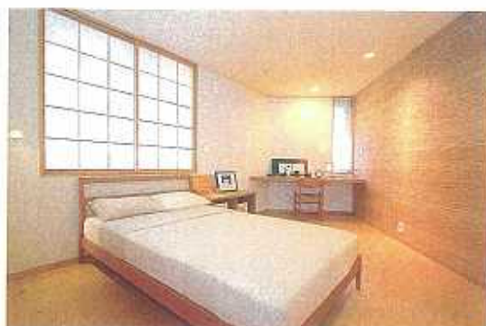
着心地の良い着替えをしつらえた生活 室には、木と障子のぬくもりがあるふれ、 心がほっとくつろぐ空間となっています。